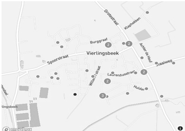
Lokaties waar in 2021 in Vierlingsbeek tuinvogels geteld werden

De Nationale Tuinvogeltelling, eind januari, kende nog nooit zoveel deelnemers als dit jaar. Landelijk hebben maar liefst bijna 200.000 mensen hun tuin of balkon geteld gedurende een half uur. Ook in Vierlingsbeek werden een record aantal tuinen geteld. Dit jaar deden 35 tuinen mee en er werden in totaal 1102 vogels geteld. Op plaats 1 en 2 staan de Huismus en de Koolmees. Landelijk is dat ook zo. Op plaats 3 staat landelijk de Pimpelmees, maar in Vierlingsbeek de Brandgans. De Brandgans is niet echt een tuinvogel. Het kan zijn dat een "grote" tuin in het buitengebied de telling sterk heeft beïnvloed. In onze kleine tuin hebben we gelukkig geen Brandgans gezien. Er zou ook niet veel ovegebleven zijn van de tuin denk ik. De telling in onze tuin komt aardig overeen met het landelijk beeld.