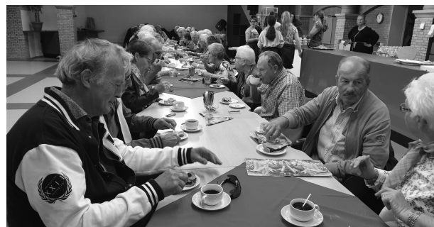
Bij Metameer in Stevensbeek aan de koffie en vlaai.

Het was een prachtige route, goed georganiseerd, en vele complimenten gegeven door de deelnemers.