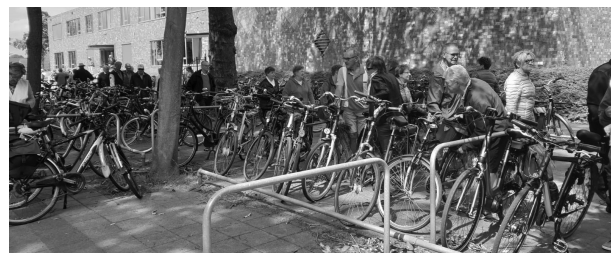
Weer op weg.