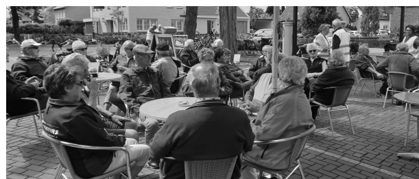
Ter afsluiting Koffie of een ijsje.