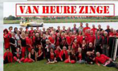
VAN HEURE ZINGE