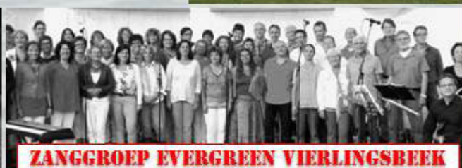
ZANGGROEP EVERGREEN VIERLINGSBEEK