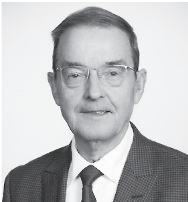
Kandidaat nummer 10.