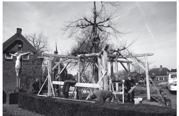
cirkel om de etagelinde bij de kapel in Groeningen heen.

Zaterdag 7 april was de dag dat de stellage (gedeeltelijk) geplaatst werd: spannend of alles zou passen! Ook hier weer hulpvaardige, enthousiaste inwoners uit Groeningen én uit Vierlingsbeek! Het CDA hield woord aan haar verkiezingsprogramma: Jan Stoffelen was er, gewapend met hand- en werkschoenen, om te helpen bij het plaatsen. Het liep zeer gesmeerd; iedereen zag wat er moest gebeuren en door de goede samenwerking stond de onderste constructie van vele houten balken, waarvan een aantal een kleine 100 kilo wegen, net na de middag al in een zeshoekige