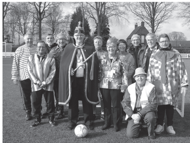
Het prinsenpaar met de leden van de wandelvoetbalclub.

Prins Teun is lid van onze wandelvoetbalclub. Ook tijdens carnaval werd er actief getraind. Op dinsdagmorgen tijdens de carnaval, gaf hij, samen met prinses Ria, de aftrap voor een onderlinge wedstrijd van de leden.