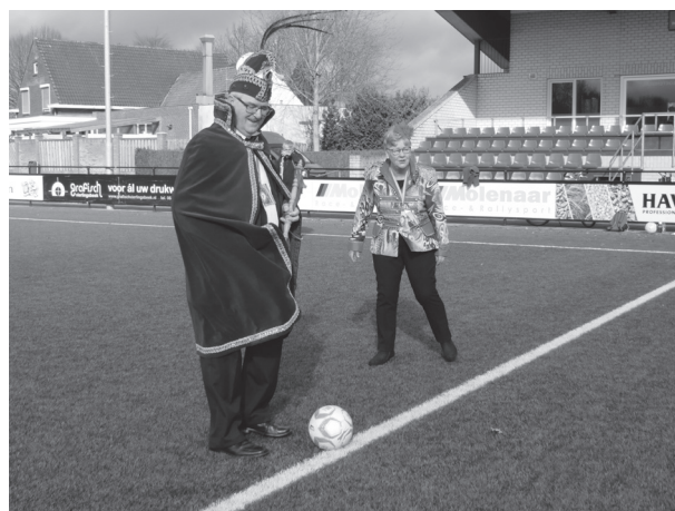
Prins Teun en Prinses Ria verrichten de aftrap voor de onderlinge wedstrijd.