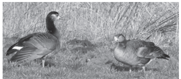
Hybride Grote Canadese Gans x Grauwe Gans

Vandaag stappen mijn telcollega en ik op de fiets om de wintervogels ten zuiden van Vierlingsbeek te tellen. Het is nog steeds prachtig weer en de mutsen en handschoenen kunnen thuis blijven. Bij de dierenweide aan de Spoorstraat laat de bruine Buizerd zich weer zien zoals hij dat al bijna de hele winter doet. Voorzichtig vliegt hij op en strijkt een stukje verder weer neer. Dat gaat zo door totdat we uit zijn gezichtsveld zijn. Via het centrum gaan we richting watermolen en de Warmeer. In het centrum kijken we vrijwel tegelijkertijd naar het dak van de kerktoren. Maar helaas de Slechtvalk die daar vaak zit, is er nu niet. De watermolen heeft geen vogels voor ons in petto, want er wordt hard gewerkt aan een nieuwe stuw die op afstand bediend kan worden. Het is er nu één grote bouwput. Daarom fietsen we snel door naar de Warmeer. Daar ontdekken we meteen 2 Boomklevers die, net als wij, al in voorjaarsstemming zijn. In rap tempo klimmen ze tegen een boomstam naar boven en weer naar beneden. Ze maken er een spelletje van en hun blauwgrijze ruggen schitteren in de zon. Met hun lange stevige snavels hakken ze krachtig in de boomschors op zoek naar insecten. Als ze wegvliegen lijken het net kleine IJsvogels. Een groep Kramsvogels vliegt over. Ze zijn al weer op weg naar noordelijker