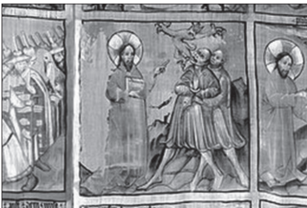
Jezus drijft een duivel uit: detail van de hongerdoek uit de Kathedraal van Gurk Oostenrijk

De laatste week, de Goede Week, is het hoogtepunt van de vastenperiode. Van deze week is het triduüm samen met de Paasdag het absolute centrum van het liturgische jaar. Het Triduüm Sacrum omvat de dagen Witte Donderdag, Goede Vrijdag en Stille Zaterdag. Traditioneel zijn deze dagen nog sterker aan het gebed gewijd. Er bestaat ook een traditie om deze dagen in retraite door te brengen.